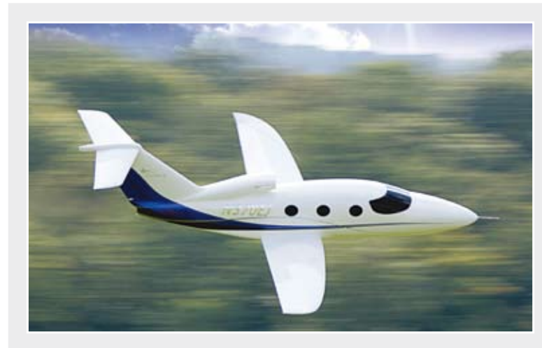
RC-Jet-Modell - Epic Victory, Spannweite 2800 mm, Strahltriebwerk 170 N Schub, Höchstgeschwindigkeit ca 450 km/h.

Eine der größten Herausforderungen war – wie so oft bei Projekten dieser Art – die Datenmigra-