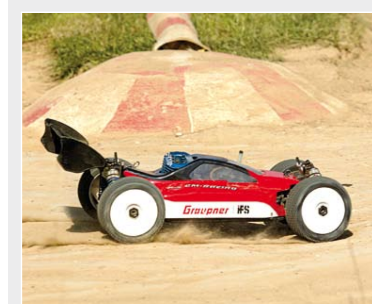
RC-Off-Road-Buggy - Hyper 9, Maßstab 1:8, 3,5 cm³ Nitro-Motor, 2,5 PS, Höchstgeschwindigkeit ca 80 km/h.

Da bei Graupner die Erschließung ausländischer Märkte ganz oben auf dem Strategiepapier steht, konnte das System der KRAFT.ALLMEDIA® auch mit seiner Unicode-Fähigkeit und seinen benutzerfreundlichen Funktionalitäten bei der Pflege von Übersetzungen überzeugen. So kann sich der Anwender die jeweilige Zielsprache auf der Oberfläche unmittelbar neben dem zu übersetzenden Feld anzeigen lassen, wobei verschiedenste Sprachkombinationen darstellbar sind. Falls gewünscht, schreibt das Überset-